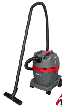
eCRAFT L-1422 Zum Nass- und Trockensaugen 22l-Behälter

Perfekt als Reinigungssauger für zuhause, im Hobbykeller, auf der Baustelle oder in der Werkstatt. Mit universell einsetzbarem Zubehör, auch für den ambitionierten Heimwerker oder für kleine Reparatur- und Montagearbeiten zwischendurch.