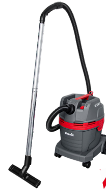
eCRAFT PL-1422 Zum Nass- und Trockensaugen, mit Filterabreinigung 22l-Behälter