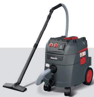
iPulse L-1635 Basic