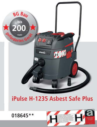
iPulse H-1235 Asbest Safe Plus