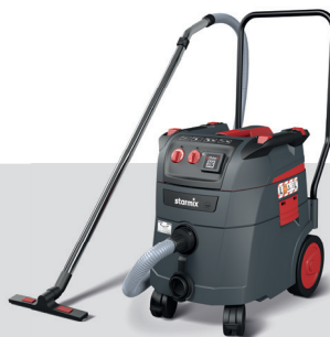
iPulse L-1635 Top