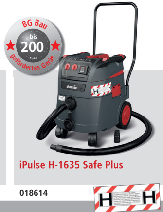
iPulse H-1635 Safe Plus