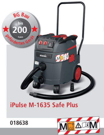
iPulse M-1635 Safe Plus