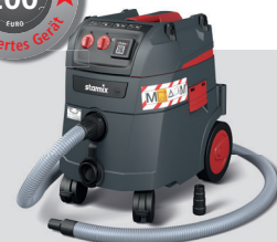
iPulse M-1635 Safe