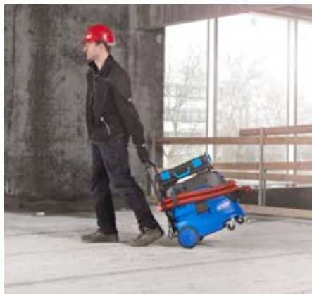
Robust und einfach handhabbar. Praktischer Transport und flexible Aufbewahrungslösung.