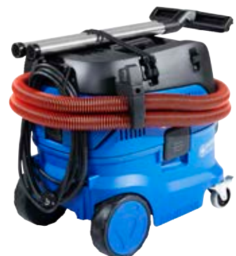
Kombinierter Schlauch- und Kabelhaken für einfaches und schnelles Aufbewahren und flexibler Riemen für Befestigung von Stromkabel, Schlauch, Zubehör und Werkzeugen.